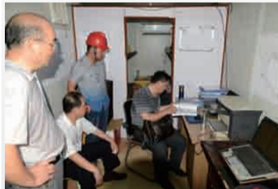
2013年7月，局安全生产督察组顶着高温到基桩公司邳州市人民医院工地和邳州市世贸大厦工地进行了检查指导。

2013年，坚持以规范化管理和提高工作效率为目的，推进管理机制的改革与创新，完善管理制度体系，强化质量管理，狠抓安全生产，实现管理体系进一步完善、管理功能进一步强化、管理水平进一步提升。