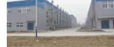
涂料厂新厂区基建工作全部结束，生产设备基本安装到位。只待外部配套条件许可，即可试生产。