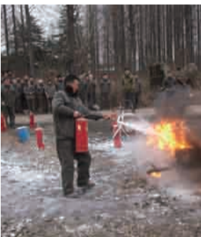
2013年2月，涂料厂在赵庄基地举行消防演练。

年底，在局总工程师泉宁的带领下，省局安全检查组一行4人到我队进行2013年度安全生产工作年终大检查。