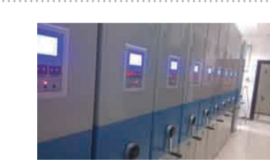
省级档案达标工作有序推进。完善了档案室硬件条件，增设了阅档室。