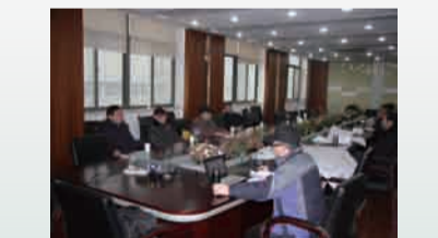
2013年2月，地勘院邀请部分在徐州老地质工作者进行座谈，为地质五队的地质找矿工作出谋划策。

按照省局广义地质工作的统计范畴，包括资源勘查、地质服务（含地质灾害评估、地质灾害治理）在内，全年共承接上级计划及市场地质综合服务143项，在全队经济中的比重达到20%以上，较2012年提高了7%。