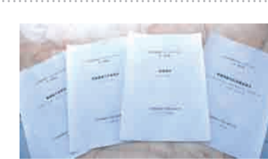
完成修志阶段性工作。提交的省矿产志资料获得省局好评，目前队志编写工作正在推进。