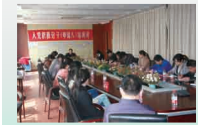
根据上级指示精神，7月底至12月底，在全体在职党员中组织开展了以“为民务实清廉”为主题的党的群众路线教育实践活动。

2013年，确保人均收入稳步增长、确保离退休职工增长工资按时代付到位、确保职工“五险一金”按时足额缴纳、确保按时组织职工体检，做到以人为本，保障职工切身利益。积极开展各类创先争优活动，涌现出一批先进集体和个人，加强党群工作，不断增强凝聚力。