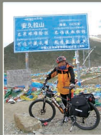
在海拔4475米的安久拉山