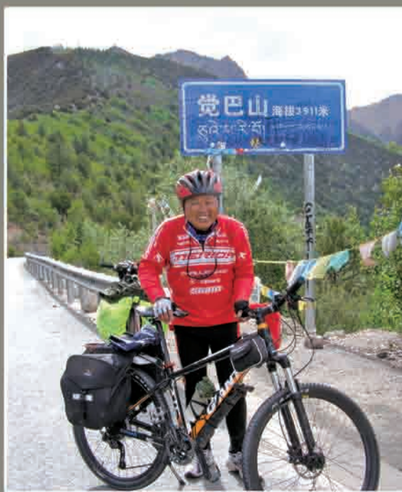
在海拔3911米的觉巴山