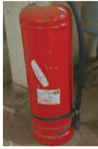
新近检修过的消防设施