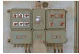
喷涂车间的防爆设施

重工喷涂车间和山西大运重卡喷涂车间进行专项安全检查。着重检查了施工车间的通风、防爆、消防、支撑枕木等安全设施。