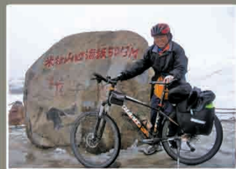
在海拔5013米的米拉山口