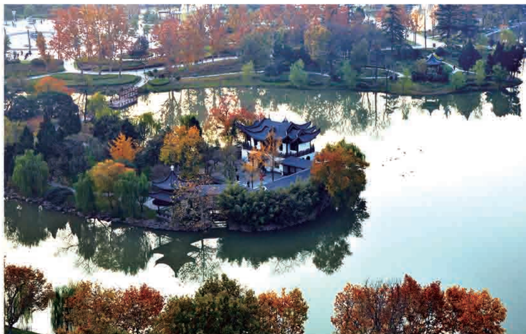
秋染燕子楼 孙晋平 (太平洋印务)