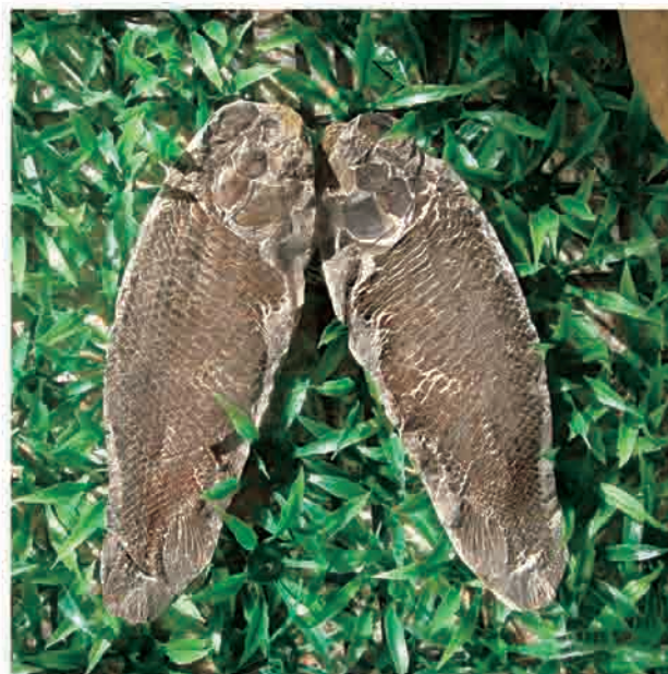
相濡以沫 (鱼化石, 摄于山东平邑博物馆) 张琪 (地勘院)