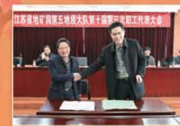
队长和书记分别与实体单位负责人签订责任书