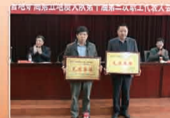
先进集体和安全先进集体登台领奖